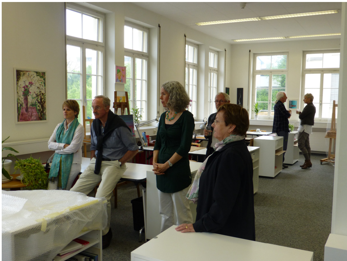
Vorstands- und Vereinsmitglieder bei der Werkstattbesichtigung an der Jahresversammlung

Da die über den Lotteriefonds finanzierte Phase nur zwei Jahre dauert, wird das Sozialamt des Kantons Zug bereits im Jahr 2014 entscheiden, ob sich die Einrichtung aus der Sicht der Behörden bewährt und ob sie einem Bedürfnis entspricht. Gelingt uns durch den laufenden Betrieb dieser Nachweis, dann stehen die Chancen gut, dass wir anschliessend vom Kanton einen Leistungsauftrag erhalten und der Interkantonalen Vereinbarung für Soziale Einrichtungen unterstellt werden.