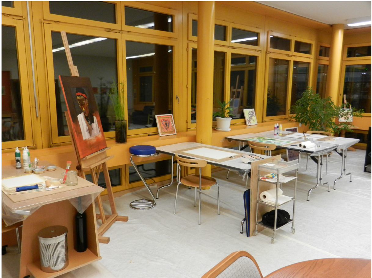
Kubeis im Kunst-Ambulatorium Baar